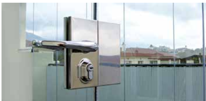
Serrure sur le premier vantail avec double béquille