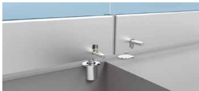
Verrouillage par loquet sur chaque vantail