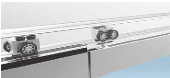
Glissières et roulements à haute performance