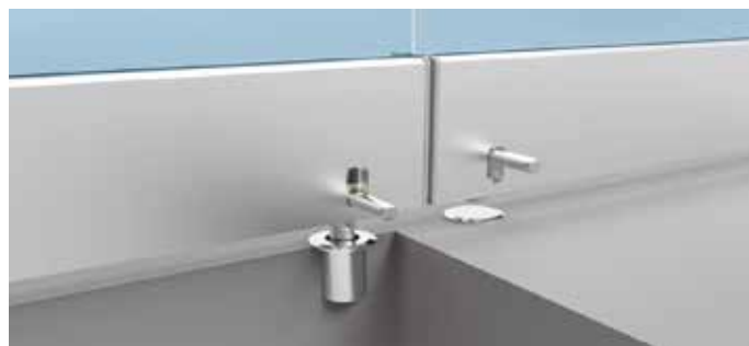
Verrouillage par loquet sur chaque vantail